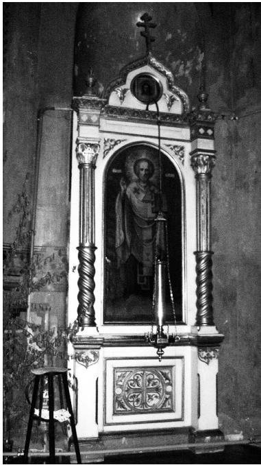
19 век. Церковь Всех Святых в Риге, киот с трехчастными колоннами.

Почему именно на колоннах нашли место эти символические смыслы? Столпы в храме, как символ святых - столпов Веры, у христиан один из самых излюбленных и важнейших художественных образов. Не только в православных, но и в католических храмах витые колонны так же неразрывно связаны с культом святых – их место в ретабло и феретронах, они присутствуют на исповедальнях, где начинается путь к святости. Обычно на мощных витых колоннах парят невесомые сени балдахинов, где покоятся реликвии и мощи святых. Спиральное движение, озаренное божественными знаниями, подчеркивается и окраской, если колонна гладкая, что говорит о важности этого символического смысла.