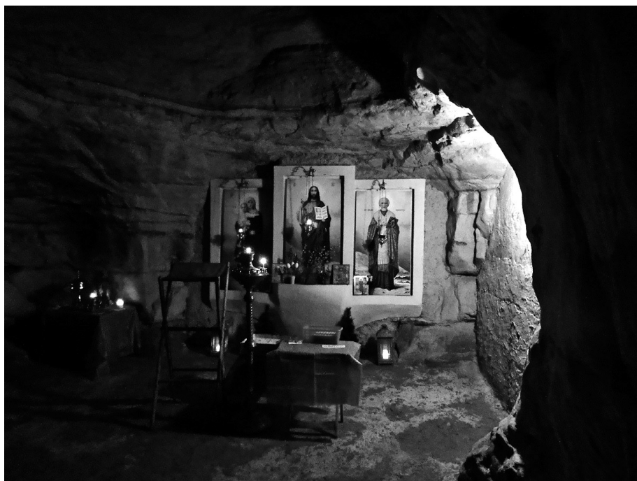
Рис. 1. Подземная часовня в пещере «Левобережная»

Одним из особо почитаемых мест в Левобережной считается подземная православная часовня (зал с иконами, лампадами, подсвечниками) (рис.1).