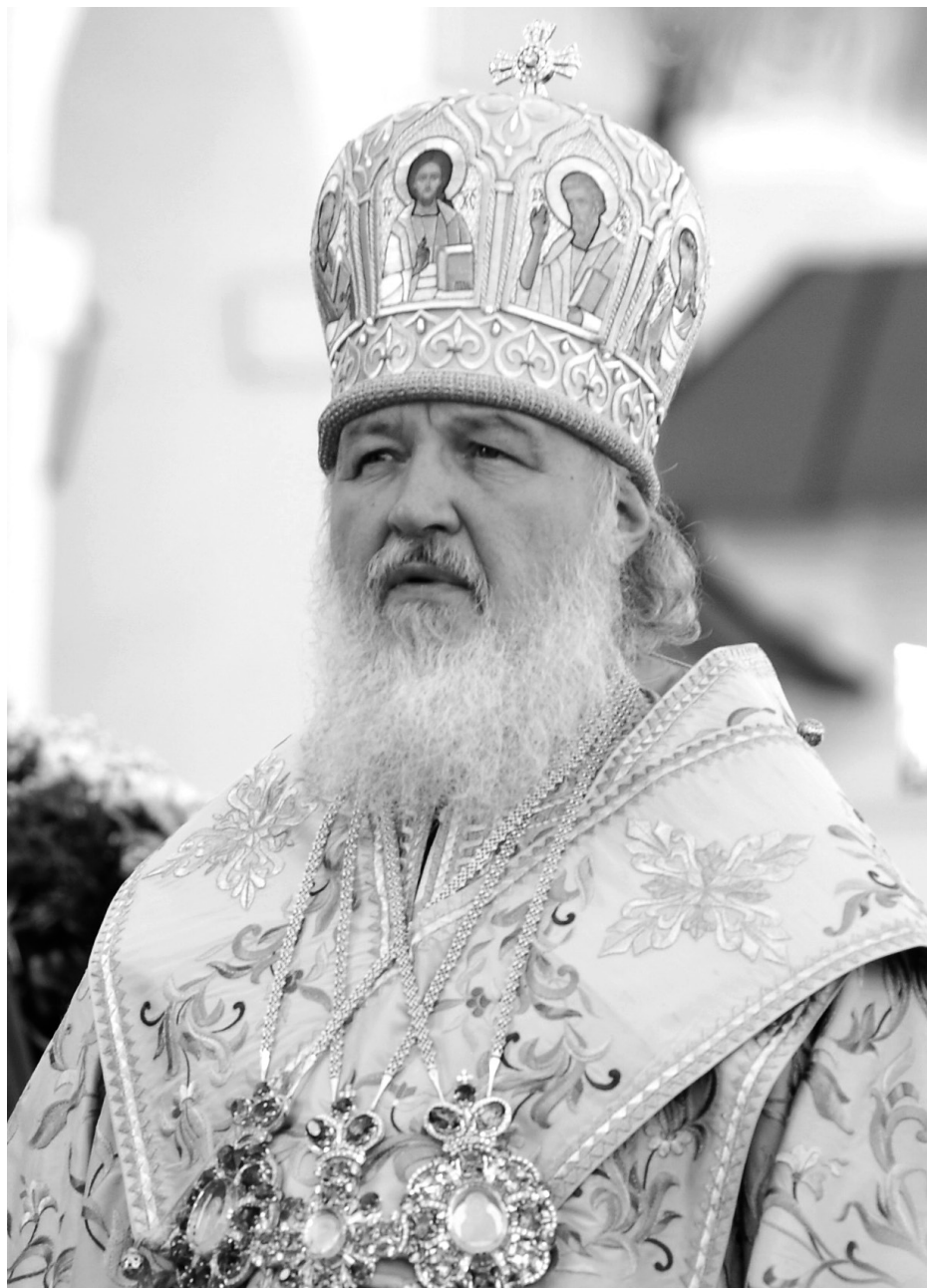
Патриарх Московский и всяя Руси КИРИЛЛ