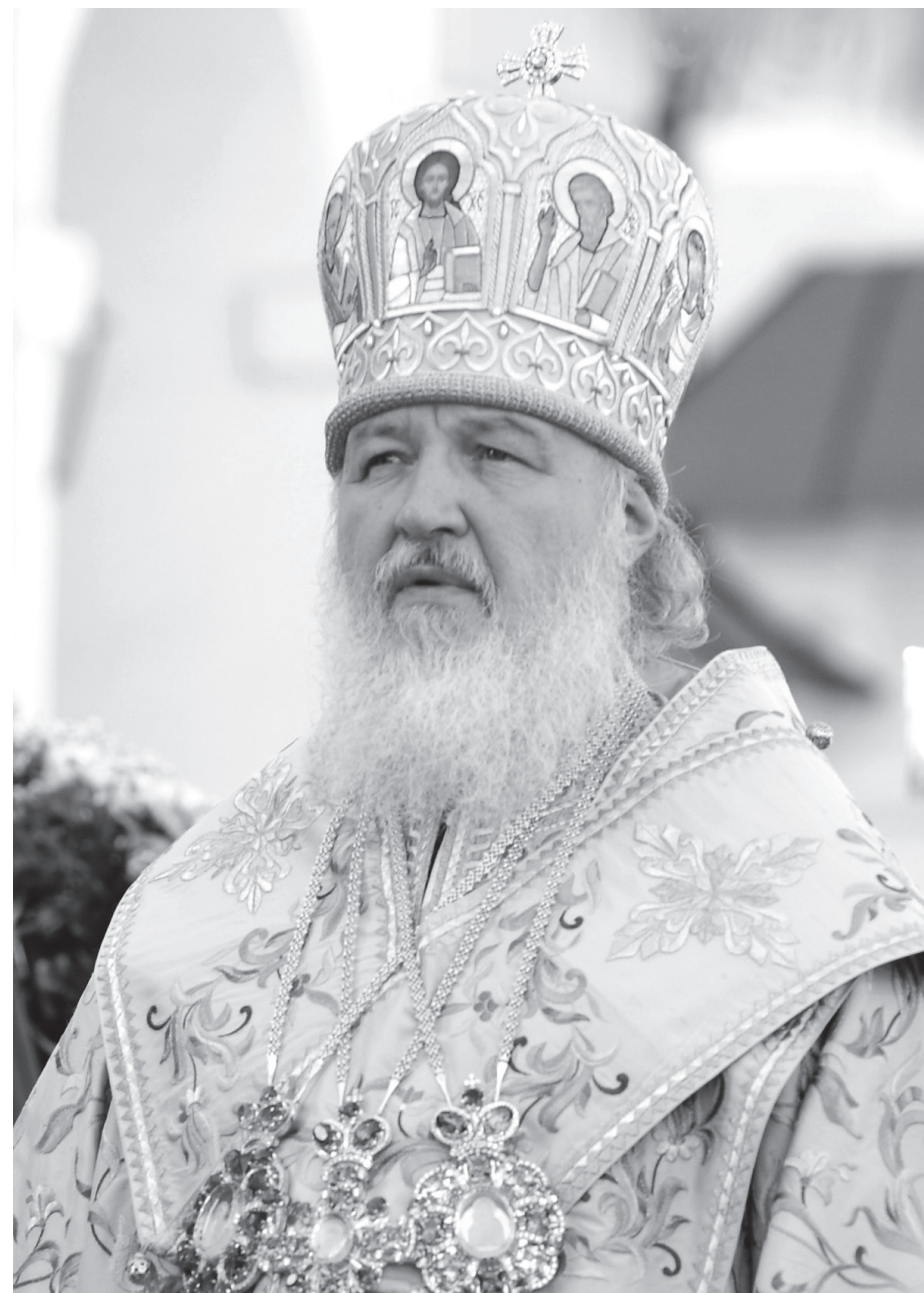
Патриарх Московский и всея Руси КИРИЛЛ